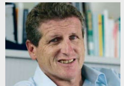
Walter Mengisen est recteur de la HEFSM et directeur suppléant de l'OFSP.

Un bon enseignant d'éducation physique doit disposer de solides connaissances en sport et éducation physique, d'un bagage théorique approprié et de vastes habiletés motrices. Les personnes les mieux formées devraient enseigner à la base. Dans la réalité, c'est toutefois l'inverse: mieux on est formé, plus haut est le degré dans lequel on enseigne!